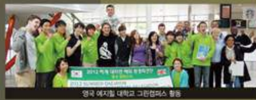
영국 예저빌 대학교 그린캠퍼스 활동