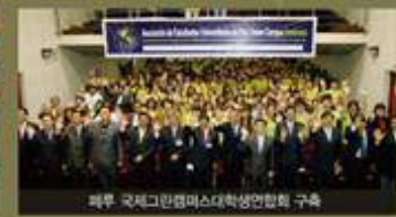
페루 국제그린캠퍼스대학생연맹회 구축