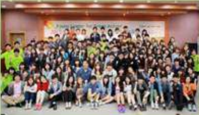
그린캠퍼스 캠페인 연수교육 Providing Green Campus Campaign training courses