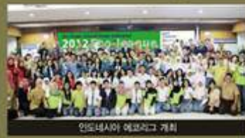
인도네시아 예고르그 개최