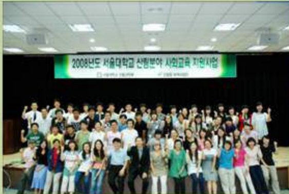
서울대학교 국제세미나 Environmental Seminar at Seoul National University

Environmental Seminar with Daejyon Report