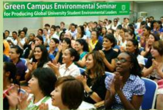
연세대학교 국제세미나 Environmental Seminar at Yonsei University