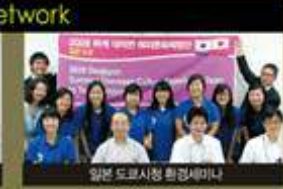
일본 도쿄시청 환경세미나