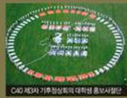
C&O 제3차 기후정상회의의 대학생 홍보사절단