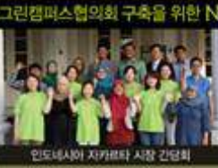
인도네시아 자카라타 시장 간담회