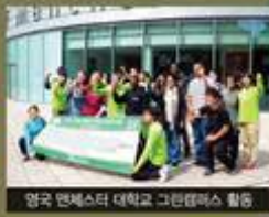
영국 맨체스터 대학교 그린캠퍼스 활동