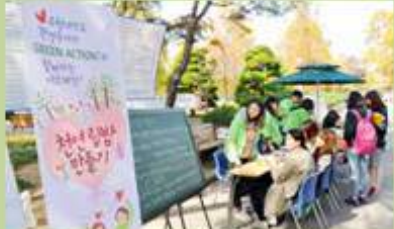
환경동아리 연간활동 프로그램 개발 및 지원 Developing and Supporting yearly activity programs