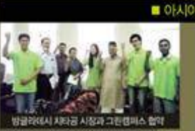
방글라데시 차라경 시장과 그린캠퍼스 협회