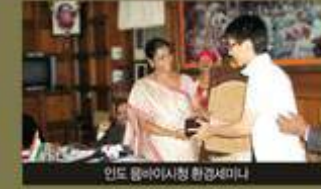
인도 뭄바이시청 환경세미나