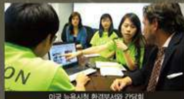
미국 뉴욕시청 환경부서와 간담회