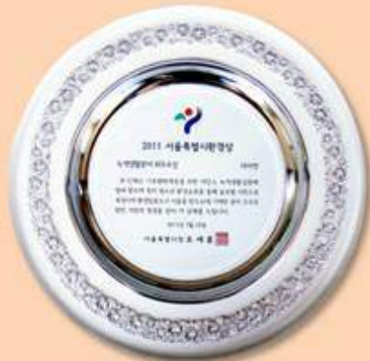
서울특별시 환경상 최우수상 서울특별시장 오세훈

Award from the Minister of Gender Equality & Family | Citation from Ministry of Public Administration and Security Grand Prize at the 16th National Volunteer Service Grand Festival | Distinguished Teacher of Youth Award from Seoul Mayor Award for Outstanding Contribution to Energy Conservation form Korean Energy Management Corporation