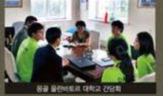
몽골 울란바토르 대학교 간담회