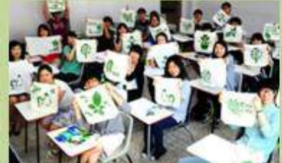
환경동아리 환경교육지원 Giving environmental education