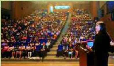
전 세계 환경동아리 에코리그 Holding Eco-leagues