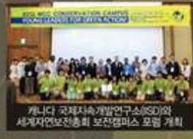
캐나다 국제재능개발연구소(CSDI)와 세계자연보전총회 보전캠퍼스 포럼 개최