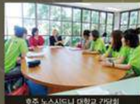
호주 노스시드니 대학교 간담회