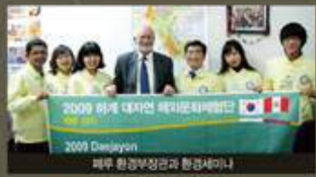
2009 세계 대자연 재자연화세미나 2009 Denlayon 페루 환경부장관과 환경세미나