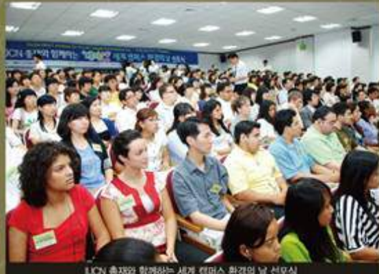
UN 총재와 함께하는 세계 캠퍼스 환경의 날 선포식

대자연은 국제그린캠퍼스협의회 구축을 위해 전 세계적인 네트워크 형성 및 MOU 체결과 간담회, 국제포럼 등 다양한 활동을 전개하고 있습니다.