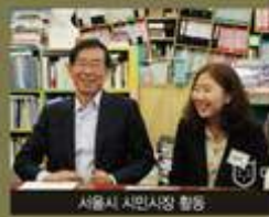
서울시 시민시장 활동