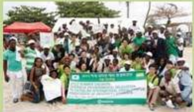
환경문제 해결을 위한 공동활동 Carrying out joint activities