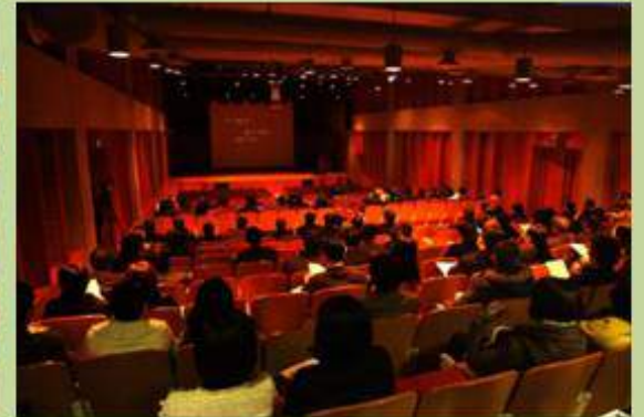
안양대학교 전교직원 세미나 Environmental seminar for the faculty of Anyang University