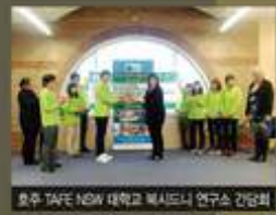
호주 TAFE NSW 대학교 북시드니 연구소 간담회