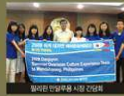
필리핀 단양시장 시장 간담회