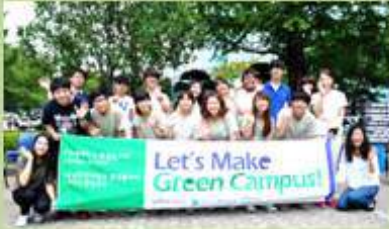
그린캠퍼스 구축 Establishing Green Campus