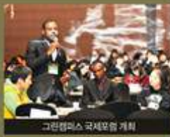
그린캠퍼스 국제포럼 개최