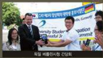
독일 베를린시장 간담회

대자연은 국제그린캠퍼스협의회 구축을 위해 전 세계적인 네트워크 형성 및 MOU 체결과 간담회, 국제포럼 등 다양한 활동을 전개하고 있습니다.