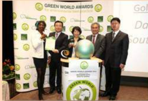
2016 그린월드 어워즈 영국 더 그린오가니제이션(영국 환경청 공인)

위 단체는 범 국민적인 기후변화대응과 녹색국가 추진을 위하여 국회기후변화포럼이 공모한 2016 대한민국 녹색기후상의 수상자로 선정되어 이 상장을 드립니다.