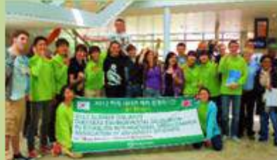
신규 환경동아리 설립 Establishing new environmental clubs