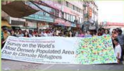
환경난민의 난민지위 획득활동 Helping environmental refugees to gain refugee status