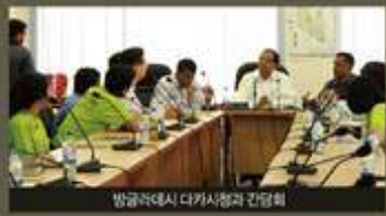
방글라데시 다카시청과 간담회