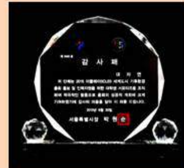
서울특별시 감사패 서울특별시장 박원순

Environmental Achievement Prize Yoo Young-sook, Korea Minister of Environment