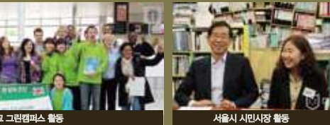
영국 맨체스터 대학교 그린캠퍼스 활동