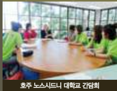
호주 노스시드니 대학교 간담회