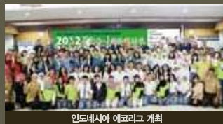
인도네시아 에코리그 개최