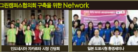
인도네시아 자카르타 시장 간담회