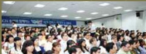
IUCN 총재와 함께하는 세계 캠퍼스 환경의 날 선포식