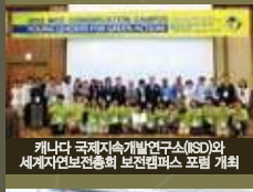
캐나다 국제지속개발연구소(ISD)와 세계자연보전총회 그린캠퍼스 포럼 개최