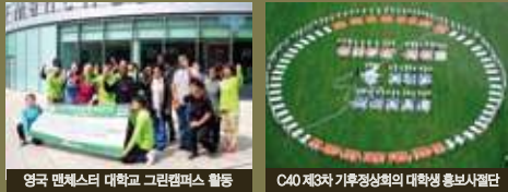
영국 맨체스터 대학교 그린캠퍼스 활동