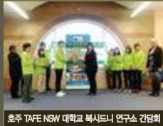
호주 TAFE NSW 대학교 북서부 연구소 간담회