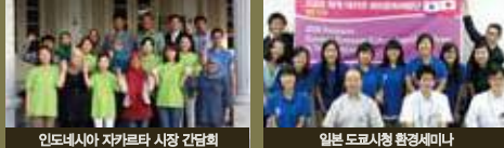
인도네시아 자카르타 시장 간담회