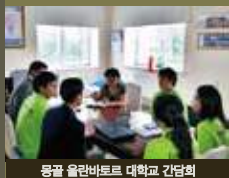
몽골 울란바토르 대학교 간담회