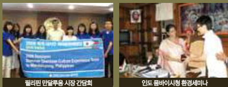
필리핀 만달루용 시장 간담회