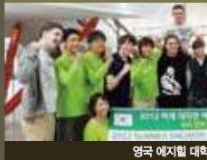
영국 에지힐 대학교 그린캠퍼스 활동