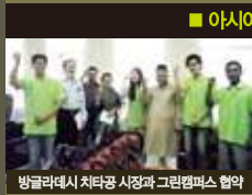
방글라데시 치타공 시장과 그린캠퍼스 협약