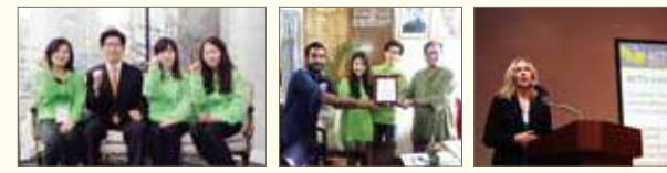
녹색연합-경기도청-경기도그린캠퍼스협의회-대자연 방글라데시 프리미어대학-대자연 호주 지속가능발전대학협의회(ACIS)-대자연