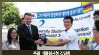
독일 베를린시청 간담회