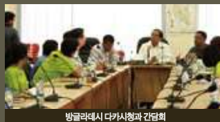
방글라데시 다카시청과 간담회