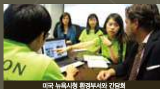
미국 뉴욕시청 환경부서와 간담회

대한민국 안전행정부 에너지관리공단 여성가족부 영국문화원 우림연지(주) 한국지속가능발전협의회 크리스탈생물(주) 푸른경기21살림협의회 하나(주) 한국수자원공사 한국청소년단체협의회 한국청소년국제친선운동 한국해양연구원 한국환경정책연구소 환경보전협회 C40세계도시기후정상회의